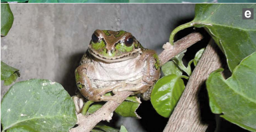
Figura 3: Comportamiento de uso de percha e historia natural de G. riobambae . Para interpretación véase texto.