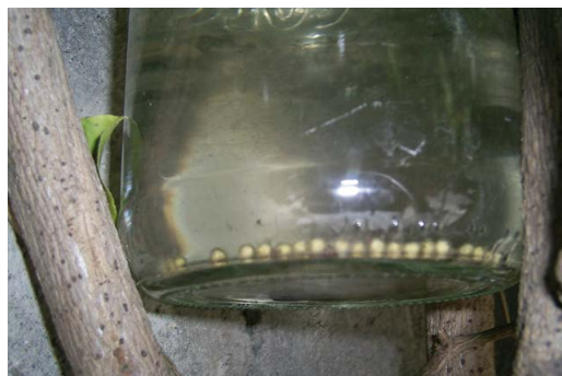
Figura 2: Puesta infértil de huevos de G. riobambae (26/06/2007).

Durante junio y agosto del 2006, y de enero a junio del 2007, se realizaron muestreos aleatorios entre las 19h00 y 00h00, en horarios de avistamientos cortos, con un total de 30 minutos de muestreo por semana y un acumulado de dos horas de muestreo por mes. Se escogieron estas épocas debido a que presentaron lluvias, las cuales son adecuadas para su actividad. Con el fin de atraer a las ranas se colocó aleatoriamente sobre el piso y una enredadera un total de seis recipientes